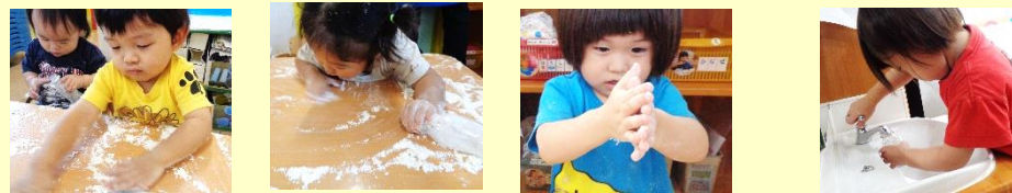
さらさら～ きめの細かい粉を何度も撒いては集める、ふう～吹く 水を自分で用意