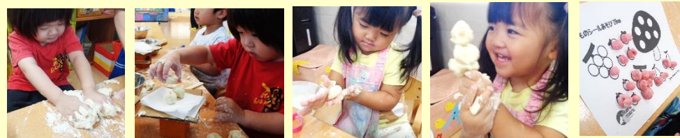
コネてコネて、ギュッギュッ、ちぎって丸めてコロコロ～ 私は 串団子♪ ○の図形に乗せました