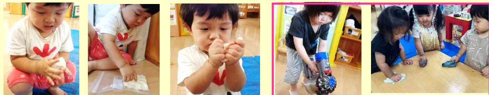
少し 苦手な感触 袋に入ったら 触れた！ 大丈夫かな？ 挑戦する意欲の育成

「遊び」は「学び」 子どもたち一人ひとりの中にはそれぞれのストーリーがあります。しっかりと見つめ、寄り添い、子どもたちの気持ちを大切に育みたいと思います。